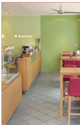
Bio-Bistro der Vitaminbude.

Innerhalb dieser gemeinschaftlichen Arbeit ist auch die vip-Karte entstanden. Damit gibt es Vitamine und Wohlbefinden besonders günstig: Für 44 Euro im ersten Jahr (danach sinkt der Beitrag kontinuierlich) erhalten Kunden 15 Prozent Rabatt auf alle Produkte der Vitaminbude (Bücher mit Preisbindung ausgenommen), im Online-Shop ( www.vitaminbude-shop.de ) sowie Vergünstigungen bei zahlreichen Angeboten der Netzwerkpartner. Neben Yogakursen, Massagen und Ernährungsberatungen zählen dazu auch das "Bergparadies" in der Schweiz (siehe Infobox) oder ein ausgezeichnetes kleines Hotel auf den Seychellen. Das Beste am Guten: