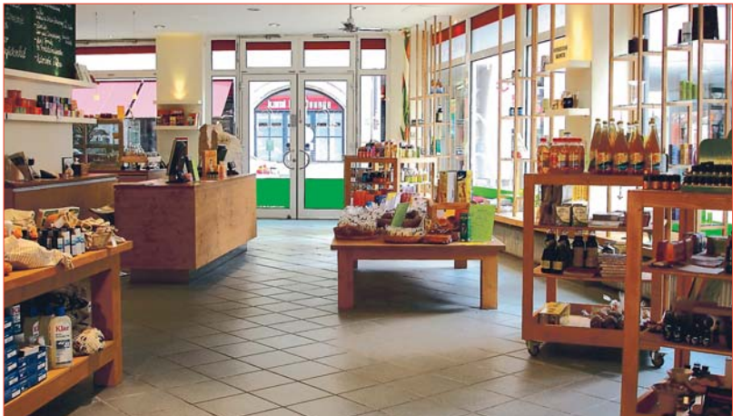
Vitaminbude – Ladengeschäft in der Kreuzstraße in München.

Der nasskalte Herbst hat uns auch in diesem Jahr wieder eingeholt. Zeit für eine Extraportion Obst, zusätzliche Vitamine. Und - wenn der Hals bereits kratzt und die Nase läuft - leider auch für einen Besuch beim Arzt. Seit Einführung der Praxisgebühr wollen viele Patienten ihre Gesundheit selbst in die Hand nehmen. Wie das geht, zeigt die Vitaminbude in Münchens Innenstadt - nicht nur wenn das Wetter wieder unbarmherziger wird.