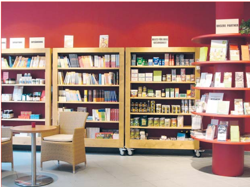
Infosäule mit Flyern und Broschüren der Netzwerkpartner.

ser ganzes Wohlbefinden hängt mit gutem, bekömmlichem Essen zusammen, aus dem wir Energie für den Tag gewinnen. Die Vitaminbude bietet für den Start in den Tag beispielsweise Obstsalat, warmen Getreidebrei oder vorzüglichen Soya-Cappuccino. Während Kunden mittags eines von drei täglich wechselnden leckeren, vollwertigen Gerichten genießen, schmökern sie in einem der von Netzwerk-Therapeuten empfohlenen Büchern oder stöbern in der in der Kreuzstraße befindlichen Partner-Säule nach Flyern und Broschüren, die alle Netzwerkpartner dort zur Mitnahme hinterlegt haben. Vorabinformationen erhalten Interessenten übrigens auch auf der Homepage der Vitaminbude, die mit dem Menüpunkt "Kooperations- und Netzwerkpartner" alle Therapeuten, Ärzte, Pädagogen, Ernährungsberater und alle weiteren Unternehmen verlinkt hat, so dass bequem mit einem Klick die gewünschte Homepage aufgerufen werden kann. Die wöchentliche Speisekarte, wie auch die Links unter www.vitaminbude.de .